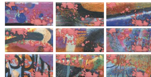
OS/A57\9x\19060 Граффити, панно из 9 частей, 9,9x20 (размер каждой части) Graffiti, decorative panel