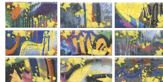
OS/A58\9x\19060 Граффити, панно из 9 частей, 9,9x20 (размер каждой части) Graffiti, decorative panel