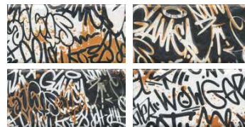
OP/A2104\19060 Граффити, панно из 4 частей, 9,9x20 (размер каждой части) Graffiti, decorative panel