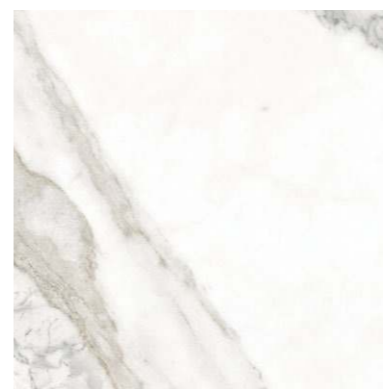
G-3013 / M / 600x600x9 Белый / White M 3