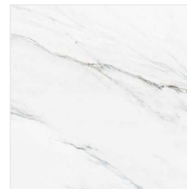
G-3011 / M / 600x600x9 Белый / White M 3