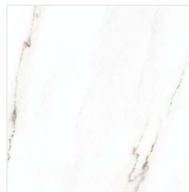
G-3010 / M / 600x600x9 Белый / White M 3