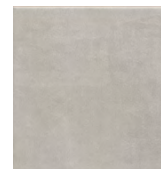
5285 Понти серый 20x20 Ponti grey