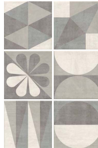
5286 Понти 20x20 Ponti