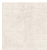
5284 Понти белый 20x20 Ponti white