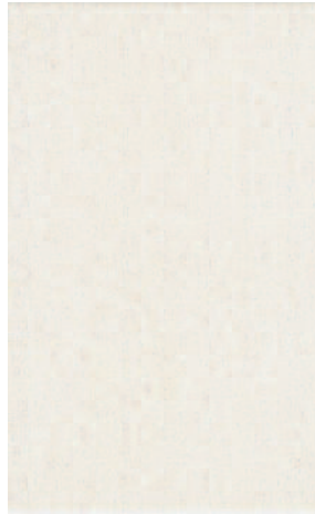
6291 Альбори 25x40 Albori