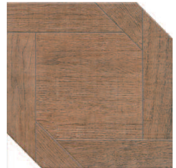
33025 Кассия коричневый 33x33 Cassia brown