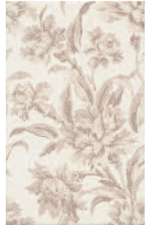
6292 Альбори Цветы 25x40 Albori Flowers