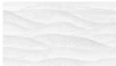
ONA BLANCO V1349942 - 100115798 33.3x59.2 cm (x9.5 mm) 13"x23 1/4" Monoporosa Wall tile V2 G233 Butech: Junta Colorstuk Blanco ✓