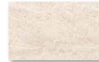
MADAGASCAR BEIGE V1239857 - 100124725 20x33.3 cm (x7.5 mm) 8"x13" Monoporosa Wall tile V2 G205 Butech: Junta Colorstuk Marfil ✓