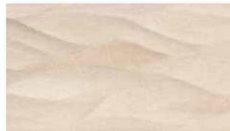
ONA BEIGE V1349943 - 100115797 33.3x59.2 cm (x9.5 mm) 13"x23 1/4" Monoporosa Wall tile V2 G233 Butech: Junta Colorstuk Marfil ✓