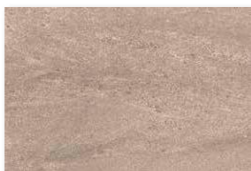
MADAGASCAR MARRÓN V5629891 - 100099196 44x66 cm (x10.1 mm) 17 3/8" x 26" Gres Porcelánico Porcelain tile V2 G344 Butech: Junta Colorstuk Marrón ✓