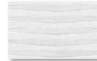
ZEUS BLANCO V1239886 100104802 20x33.3 cm (x11.6 mm) 8"x13" Monoporosa Wall tile V2 G222 Butech: Junta Colorstuk Blanco ✓