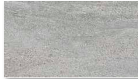
MADAGASCAR NATURAL V1349940 - 100115437 33.3x59.2 cm (x8.6 mm) 13"x23 1/4" Monoporosa Wall tile V2 G226 Butech: Junta Colorstuk Gris ✓