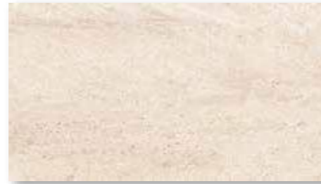
MADAGASCAR BEIGE V1349938 - 100115435 33.3x59.2 cm (x8.6 mm) 13"x23 1/4" Monoporosa Wall tile V2 G226 Butech: Junta Colorstuk Marfil ✓