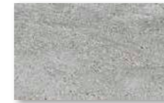
MADAGASCAR NATURAL V1239858 - 100124185 20x33.3 cm (x7.5 mm) 8"x13" Monoporosa Wall tile V2 G205 Butech: Junta Colorstuk Gris ✓