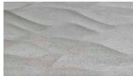
ONA NATURAL V1349941 - 100115799 33.3x59.2 cm (x9.5 mm) 13"x23 1/4" Monoporosa Wall tile V2 G233 Butech: Junta Colorstuk Gris ✓