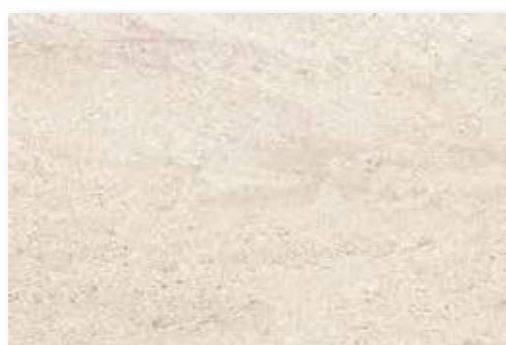
MADAGASCAR BEIGE V5629892 - 100099195 44x66 cm (x10.1 mm) 17 3/8" x 26" Gres Porcelánico Porcelain tile V2 G344 Butech: Junta Colorstuk Marfil ✓