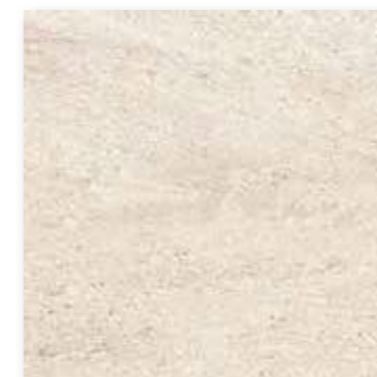
MADAGASCAR BEIGE V5460007 - 100100419 44.3x44.3 cm (x9.4 mm) 17 1/2" x 17 1/2" Gres Porcelánico Porcelain tile V2 G311 Butech: Junta Colorstuk Marfil ✓