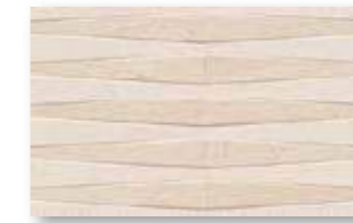
ZEUS BEIGE V1239889 100104800 20x33.3 cm (x11.6 mm) 8"x13" Monoporosa Wall tile V2 G222 Butech: Junta Colorstuk Marfil ✓