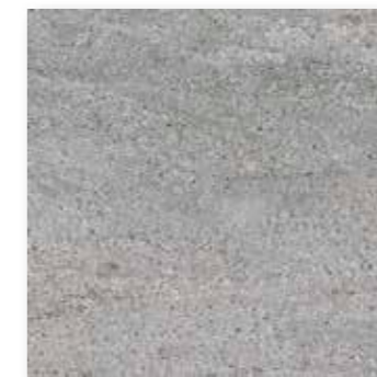
MADAGASCAR NATURAL V5460008 - 100100421 44.3x44.3 cm (x9.4 mm) 17 1/2" x 17 1/2" Gres Porcelánico Porcelain tile V2 G311 Butech: Junta Colorstuk Gris ✓