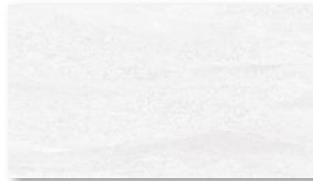
MADAGASCAR BLANCO V1349939 - 100115436 33.3x59.2 cm (x8.6 mm) 13"x23 1/4" Monoporosa Wall tile V2 G226 Butech: Junta Colorstuk Blanco ✓