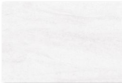
MADAGASCAR BLANCO V5629881 - 100105105 44x66 cm (x10.1 mm) 17 3/8" x 26" Gres Porcelánico Porcelain tile V2 G344 Butech: Junta Colorstuk Blanco ✓