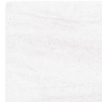
MADAGASCAR BLANCO V5460010 - 100106055 44.3x44.3 cm (x9.4 mm) 17 1/2" x 17 1/2" Gres Porcelánico Porcelain tile V2 G311 Butech: Junta Colorstuk Blanco ✓