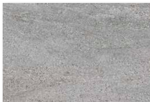
MADAGASCAR NATURAL V5629890 - 100099197 44x66 cm (x10.1 mm) 17 3/8" x 26" Gres Porcelánico Porcelain tile V2 G344 Butech: Junta Colorstuk Gris ✓