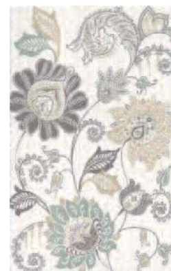
6234 Луиза 25x40 Louisa