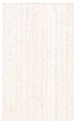
6233 Луиза беж 25x40 Louisa beige

POD002 Бисер прозрачный люстр 20x0,6 Beads transparent luster