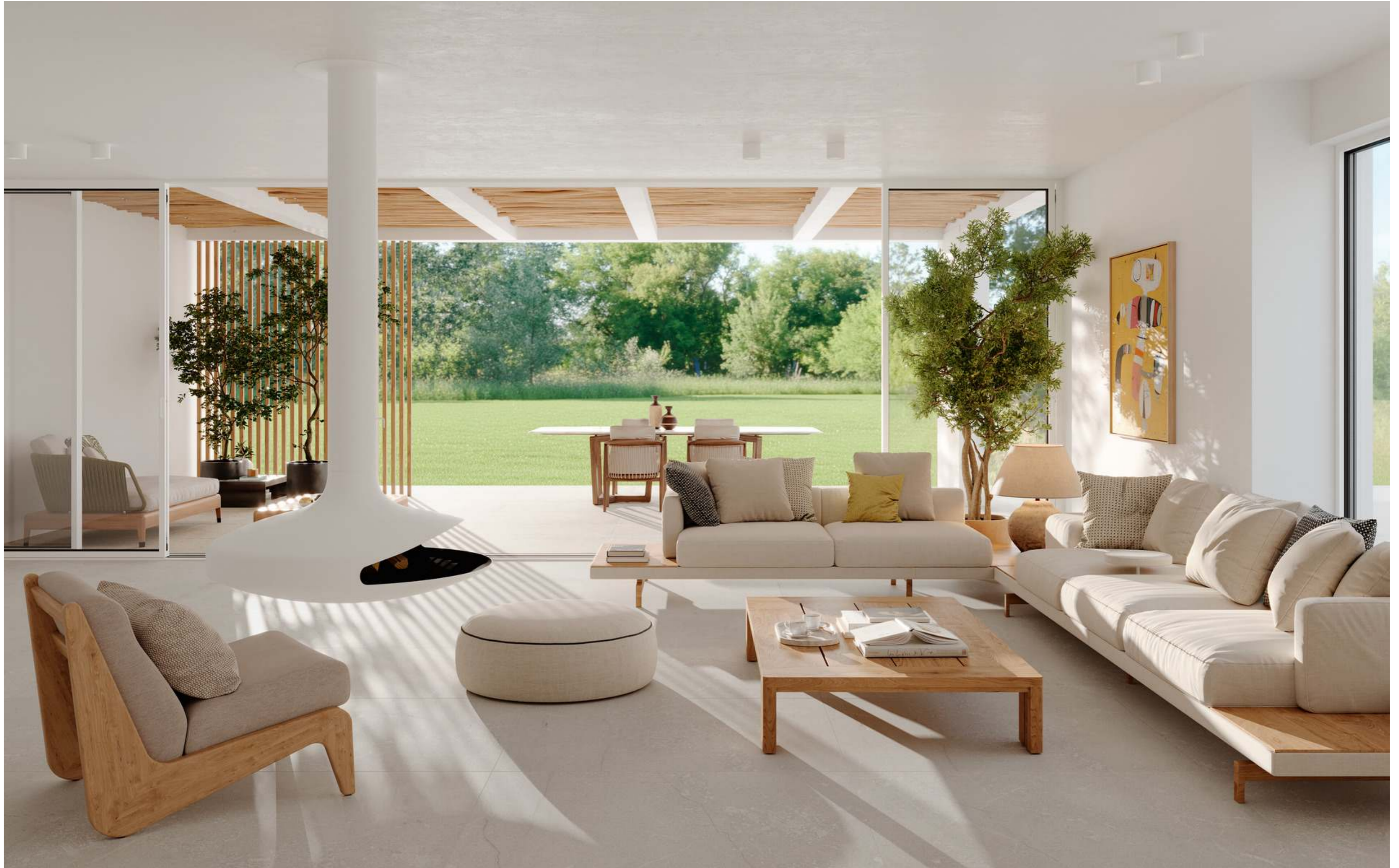
MQE6 Mystone Pietra Di Sicilia Grigio Puntinato Rt 60x120cm MQCY Mystone Pietra Di Sicilia Grigio Rt 60x120cm