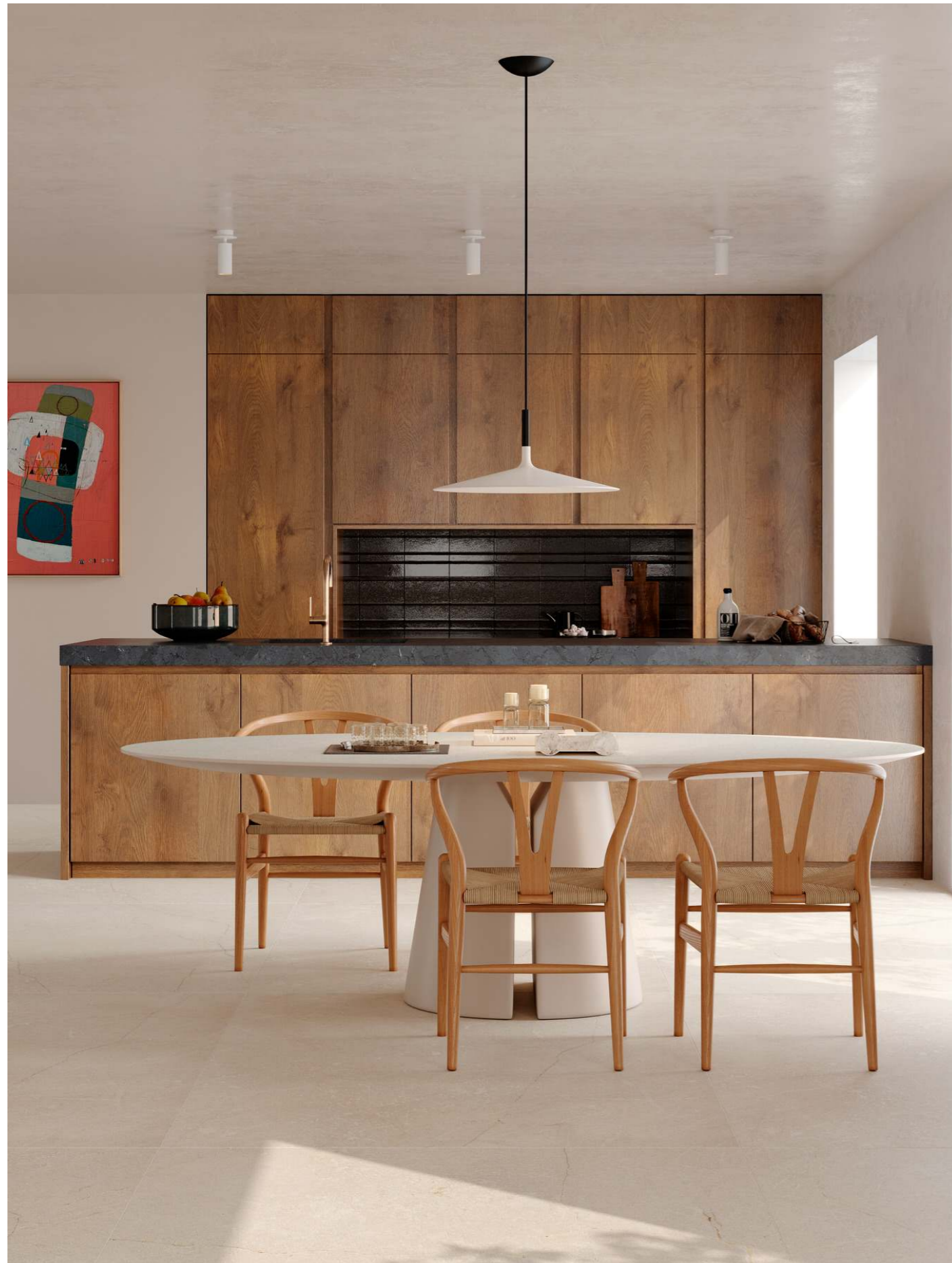
MQCM Mystone Pietra Di Sicilia Bianco Rt 120x120cm MQ8U Grande Concrete Look Ivory Struttura Pressata Natural Rt 160x320cm MPS3 Terramater Carbone Struttura 3D Ritmo Lux 18x37cm MPH2 Grande Stone Look Infinity Anthracite Satin 3D Ink Rt 6Mm 160x320cm