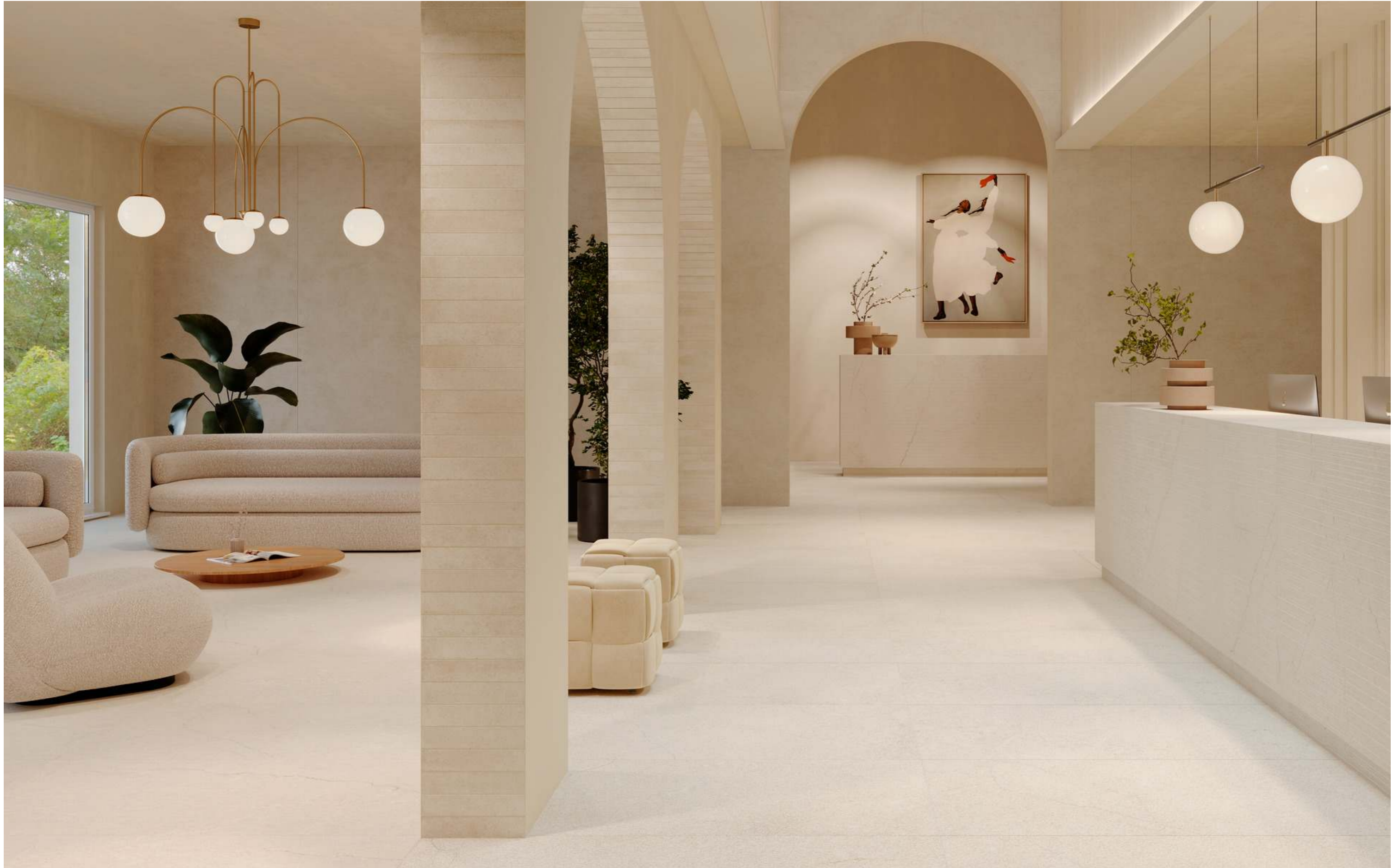
MQ70 Grande Concrete Look Slow Calce Satin 3D Ink Rt 160x320cm MGTA Artcraft Pomice 5x30cm