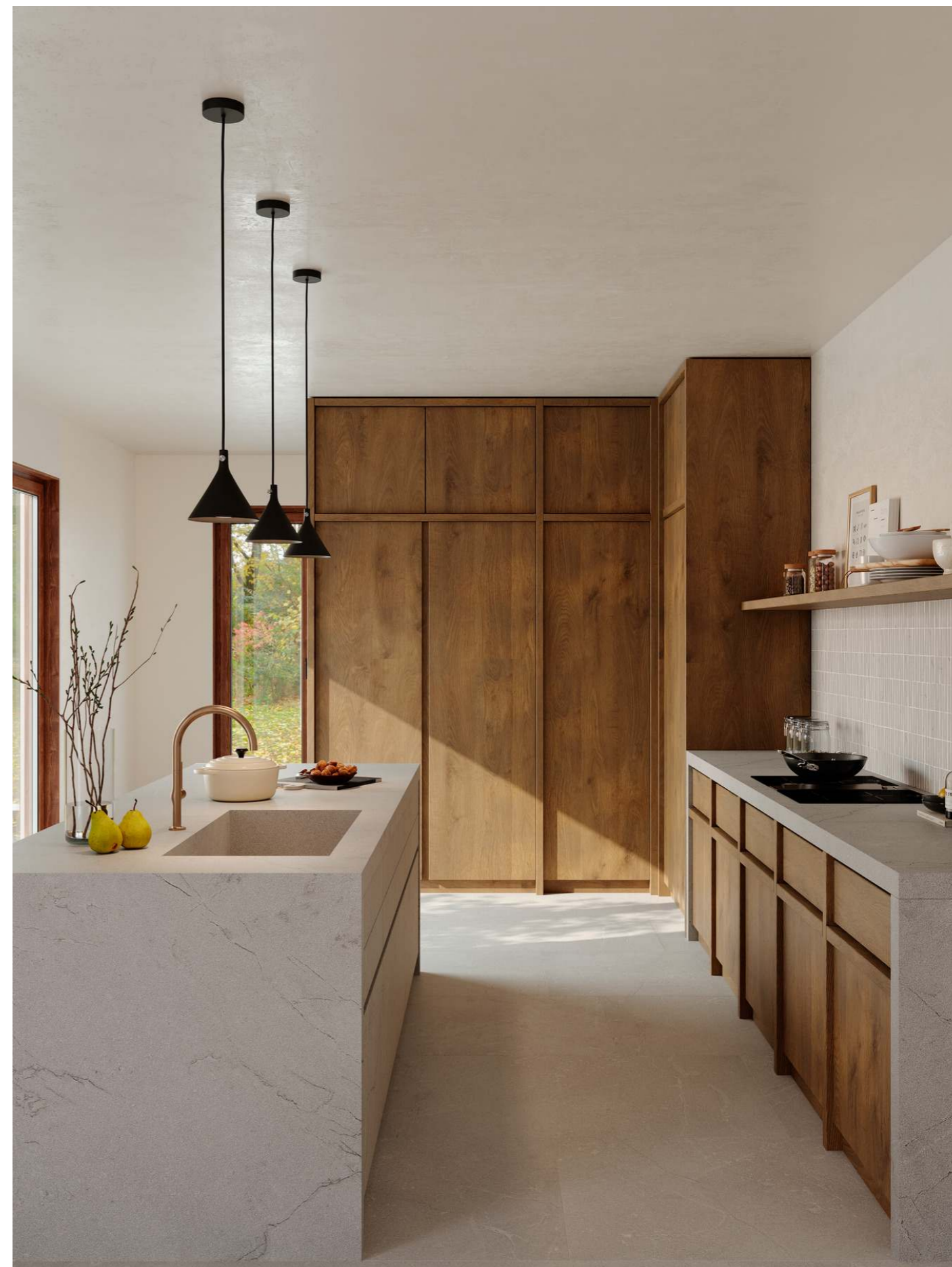
MQGU Mystone Pietra Di Sicilia Grigio Mosaico Stick 31x31cm MQCY Mystone Pietra Di Sicilia Grigio Rt 60x120cm MQ9S Grande Stone Look Pietra Di Sicilia Grigio Satin 3D Ink Rt 160x320cm MQ9K Grande Stone Look Pietra Di Sicilia Grigio Riga 3D Ink Naturale Rt 120x278cm