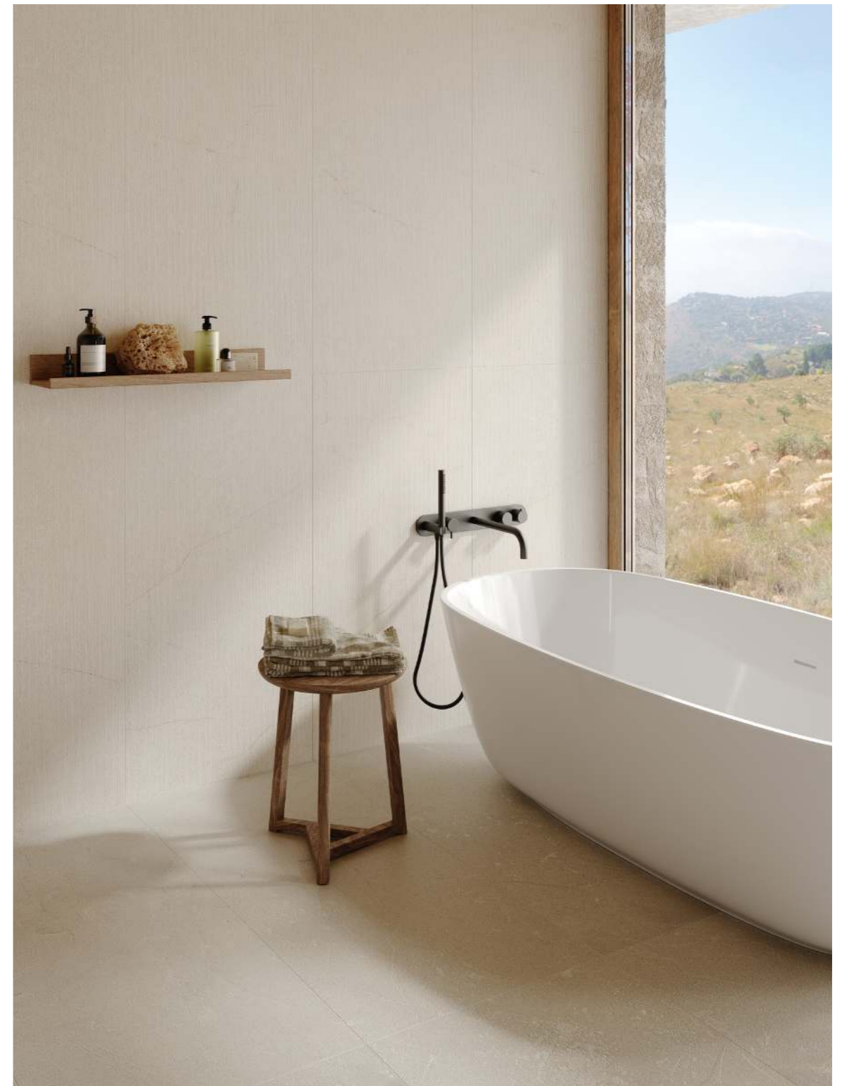
MQE7 Mystone Pietra Di Sicilia Bianco Rigato Rt 60x120cm MQCW Mystone Pietra Di Sicilia Grigio R10 Rt 60x120cm