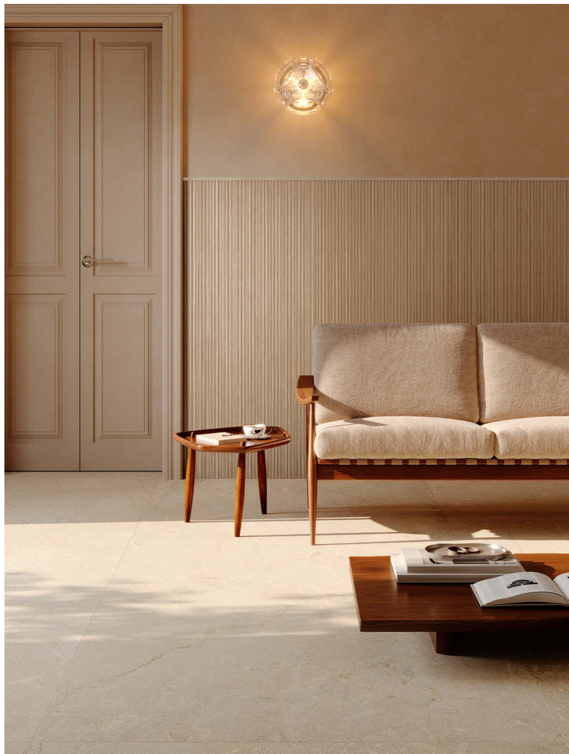
MQLY Crea Listello Bronzo Rt 1x120cm MQDW Crea Forma01 3D Rovere Scuro Rt 60x135cm MQCZ Mystone Pietra Di Sicilia Beige Rt 60x120cm