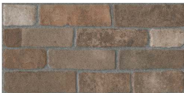
SG250000N Кампалто 30x60 Campalto