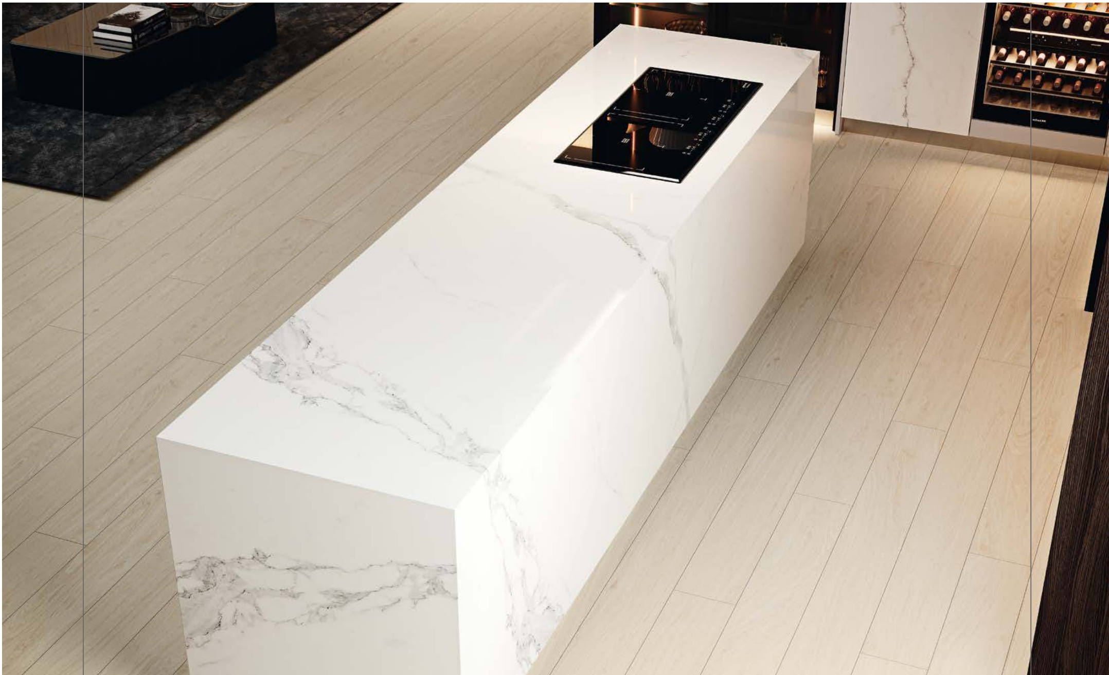
ESTATUARIO BOOK 10,5 MM / 12 MM