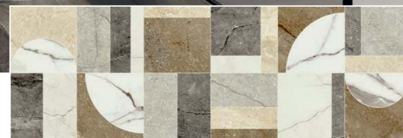
• Class Mix 33,3x100 Rec. M48 031.627.0100.10354

Rvto. / Wall / Rvto. / Pared: Rlv. Torano Brillo 33,3x100 - Torano Brillo 33,3x100 Pvto. / Floor / Sol: At. Acadian Wengue 23x120