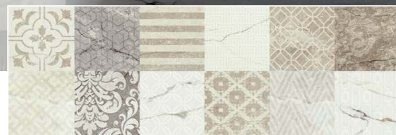
• Oasis Mix 33,3x100 Rec. M48 031.627.0100.10100