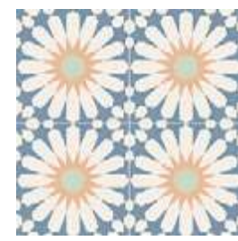
Soleil Blue GF-20300D 33,15x33,15 / 13,1"x13,1"