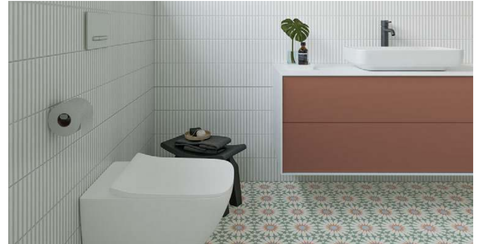
Taco Soleil Mint 16,5x16,5 / 6,5"x6,5" · Deco Lingot White 32x62,5 / 12,6"x24,6"