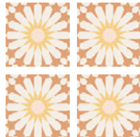
Taco Soleil Orange 16,5x16,5 cm / 6,5"x6,5"

33,15x33,15 cm / 13,1"x13,1" 16,5x16,5 cm / 6,5"x6,5"