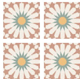
Taco Soleil Burdeos 16,5x16,5 cm / 6,5"x6,5"