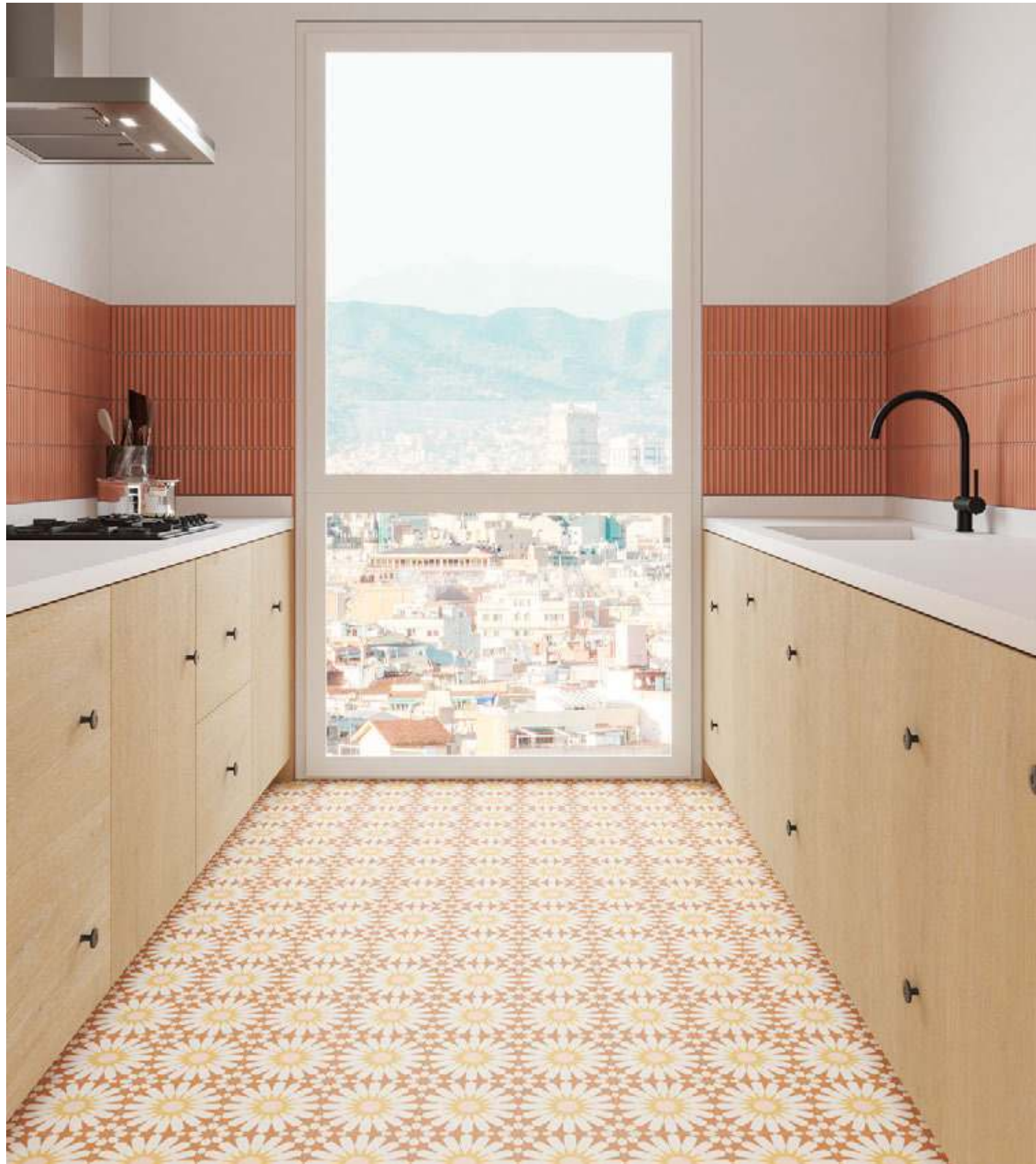
Taco Soleil Orange 16,5x16,5 / 6,5"x6,5" · Deco Lingot Coral 32x62,5 / 12,6"x24,6"

33,15x33,15 cm / 13,1"x13,1" 16,5x16,5 cm / 6,5"x6,5"