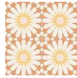
Soleil Orange GF-20300D 33,15x33,15 / 13,1"x13,1"