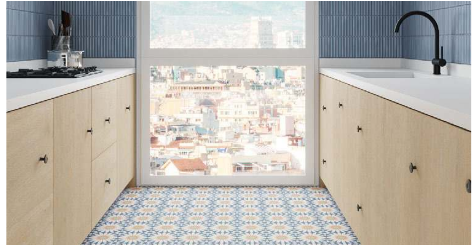
Taco Soleil Blue 16,5x16,5 / 6,5"x6,5" · Deco Lingot Blue 32x62,5 / 12,6"x24,6"