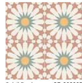
Soleil Burdeos GF-20300D 33,15x33,15 / 13,1"x13,1"