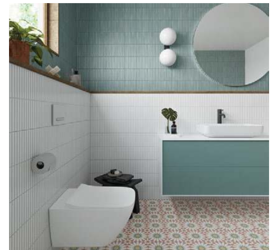
Deco Lingot Aqua 32x62,5 / 12,6"x24,6" · Deco Lingot White 32x62,5 / 12,6"x24,6" Taco Soleil Burdeos 16,5x16,5 / 6,5"x6,5"