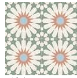
Soleil Mint GF-20300D 33,15x33,15 / 13,1"x13,1"