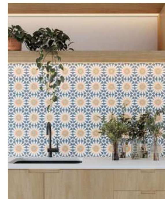
Taco Soleil Blue 16,5x16,5 / 6,5"x6,5"